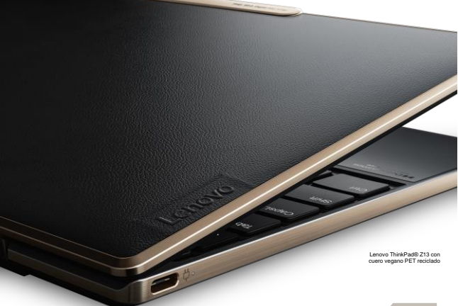
Lenovo ThinkPad® Z13 con cuero vegano PET reciclado

La ThinkPad Z Series con procesadores AMD Ryzen™ PRO está protegida en base a un modelo Zero Trust, implementando una plataforma ThinkShield y procesador de seguridad Microsoft Pluton integrado.