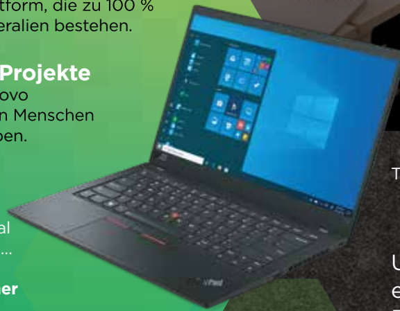
ThinkPad® X1 Carbon

Unter www.lenovo.com/esg erfahren Sie mehr über unser Engagement im Bereich Umwelt, Gesellschaft und Governance (ESG).