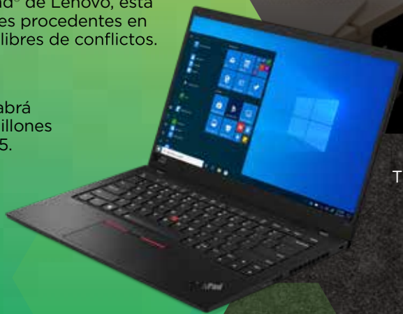
ThinkPad® X1 Carbon

Obtén más información sobre nuestras iniciativas medioambientales, sociales y de gobierno (ESG) en www.lenovo.com/esg .