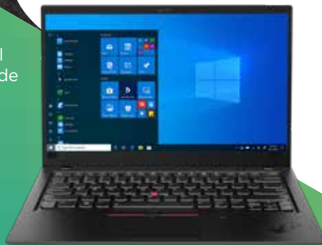
ThinkPad® X1 Carbon

Piezas de PC devueltas a nuestro centro de servicio para su reparación y uso futuro. 2